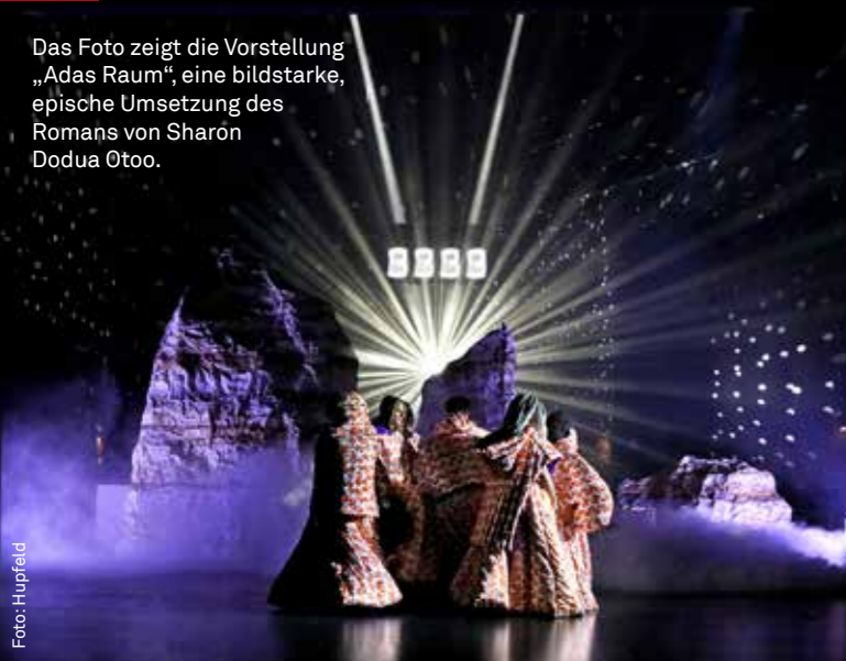
Das Foto zeigt die Vorstellung „Adas Raum“, eine bildstarke, epische Umsetzung des Romans von Sharon Dodua Otoo.

Wie wäre es mit einem entspannenden (oder vielleicht auch nachdenklichen) Abend im Dortmunder Stadttheater – bei einer Vorstellung/Aufführung Ihrer persönlichen Wahl?