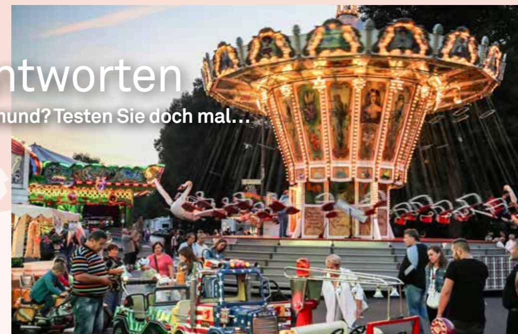
Die Kohlenkirmes hat eine lange Tradition und findet wo statt?