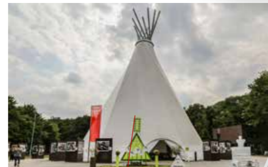
Big Tipi, Fredenbaum