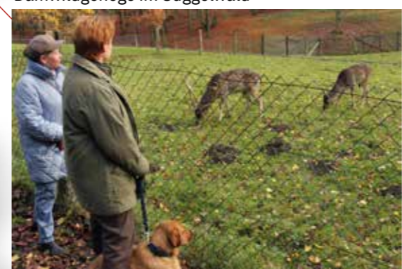
Damwildgehege im Süggelwald