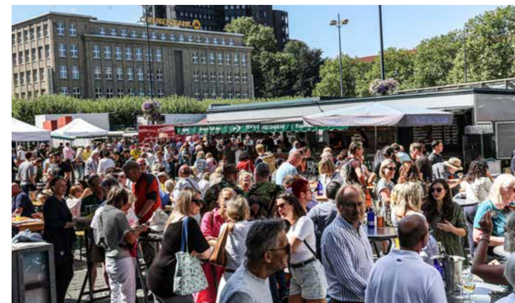
Wein, Kaffee, Snacks: Der Markt ist samstags für viele Menschen zu einem festen Treffpunkt und zu einem Ort geworden, der Lebensgefühl vermittelt.

Das Angebot jedenfalls ist hochwertig und wohl teurer als im Supermarkt.