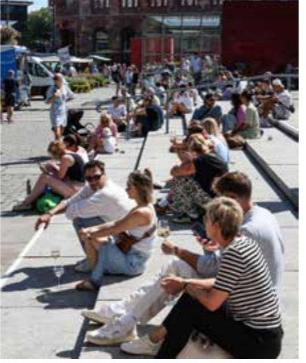
Chillen und Bekannte treffen: Vor allem junge Leute machen es sich gern auf den Treppen bequem und genießen das bunte Treiben.

Wenn er auch nicht immer auf dem Hansaplatz stattfindet. Mal Friedensplatz, mal Alter Markt, mal Reinoldikirche – der Markttag bleibt für sie eine Konstante, sie ist jede Woche da. Sie mag sich nichts schicken lassen und möchte keine abgepackte Ware.