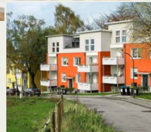
Gansmannshof in Dortmund-Berghofen

Ähnlich ist DOGEWO21 bei der Instandhaltung und dem Ausbau der Häuser Gansmannshof 7–13 vorgegangen: Seit 2017 wird die Gaszentralheizung auch hier von einer modernen Luftwärmepumpe unterstützt. Der 2019 fertiggestellte Neubau an der Schüruferstraße sowie die 2017 in die Vermietung gegangenen neuen Wohnungen an der Brache arbeiten ebenfalls mit dieser bivalenten Luftwärmepumpe mit Gasunterstützung.